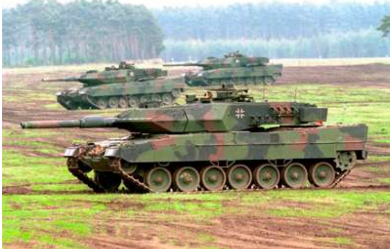
Танки "Леопард-2А5" бундесвера

В настоящее время сухопутные войска Германии являются достаточно компактными по составу: 5 дивизий (2 танковые, мотопехотная, аэромобильная и специальных операций) и 9 отдельных бригад (3 танковые, 2 мотопехотные, горно-пехотная, 2 воздушно-десантных, воздушно-механизированная). Военно-политическое руководство ФРГ рассматривает вероятность внешнего вторжения на территорию страны как крайне незначительную. Сама Германия тоже не заинтересована в развязывании наступательных войн с кем бы то ни было. Тем не менее, достаточно реалистичной является возможность участия германской армии в различных военных операциях совместно с партнерами по НАТО. В операциях такого рода, боевые действия, скорее всего, будут носить наступательный и маневренный характер, поэтому маршевой подготовке соединений и частей уделяется особое внимание.